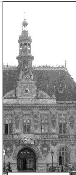
Hôtel de ville de Niort

Création du Siège de la Communauté de Communes de la Vingeanne à Longeau Percey (HQE)