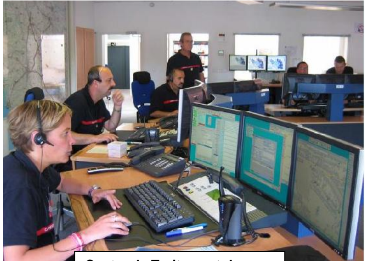
Centre de Traitement des Alertes du SDIS de l'Aube