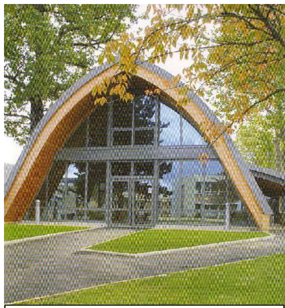
Restaurant scolaire à Livry gargan

Restructuration du restaurant scolaire à NUITS SAINT GEORGES (HQE)