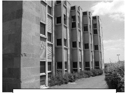
Foyer des jeunes Travailleurs de Langres